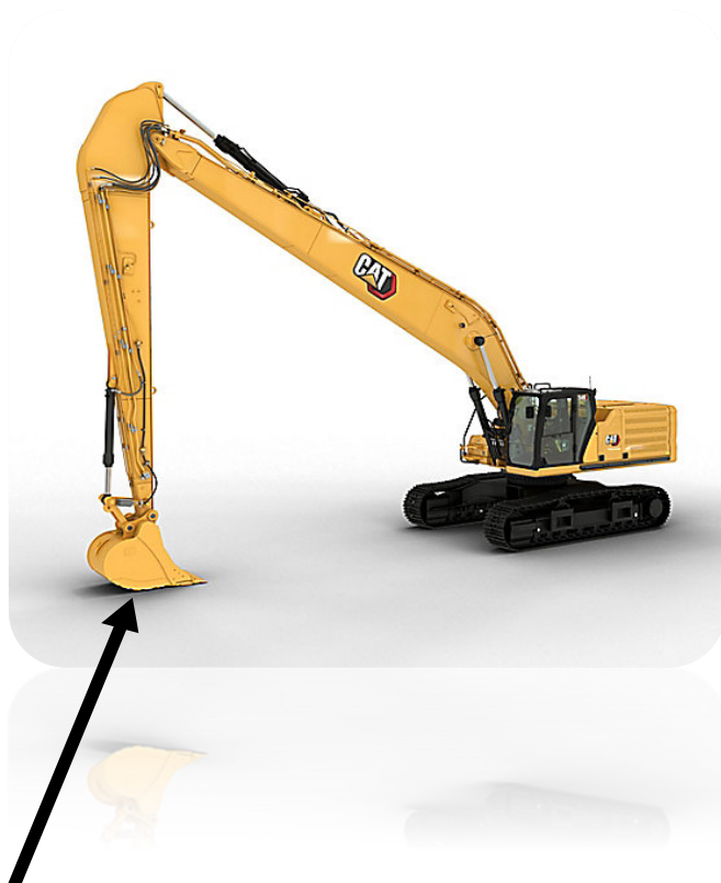
BASE DEL CUCHARON