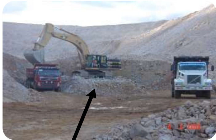
ALTURA DE LA PLATAFORMA O CAMA 1.50 METROS

Para aumentar la producción también se puede realizar el método de carguío en dos carriles donde el operador tendrá que realizar su propia plataforma o cama para mejor visibilidad de la tolva del volquete y así centrar bien la carga y así evitar imprevistos.